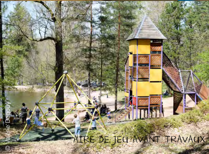
AIRE DE JEU AVANT TRAVAUX