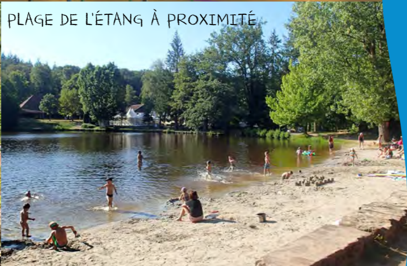
PLAGE DE L'ÉTANG À PROXIMITÉ