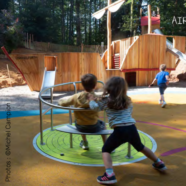
AIRE DE JEU APRÈS TRAVAUX