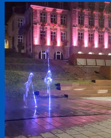
FONTAINE PLACE DE LA LÉGION D'HONNEUR ↑

L'opération s'est poursuivie, au début de l'année 2025, avec le remplacement de l'éclairage du stade de football et l'éclairage des bâtiments publics : bâtiments administratifs, de services, scolaires et sportifs (plus d'une vingtaine de sites). Par ailleurs, les éclairages extérieurs de