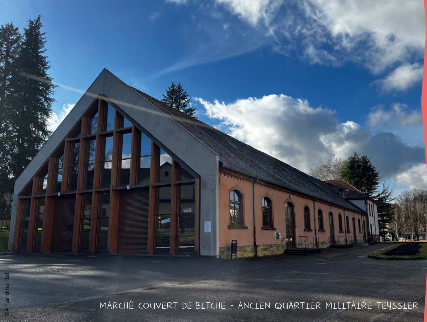
MARCHÉ COUVERT DE BITCHE - ANCIEN QUARTIER MILITAIRE TEYSSIER