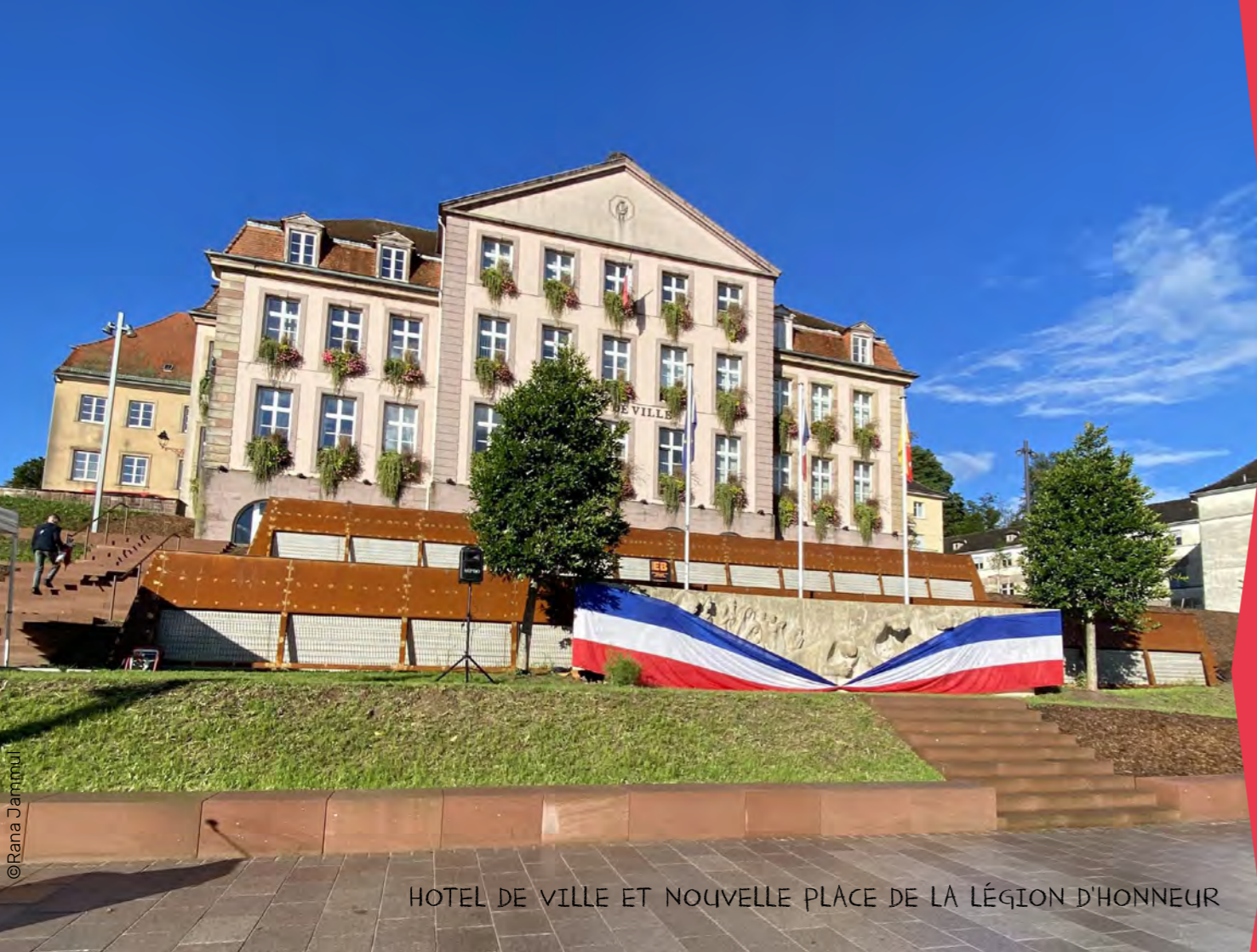
HOTEL DE VILLE ET NOUVELLE PLACE DE LA LÉGION D'HONNEUR