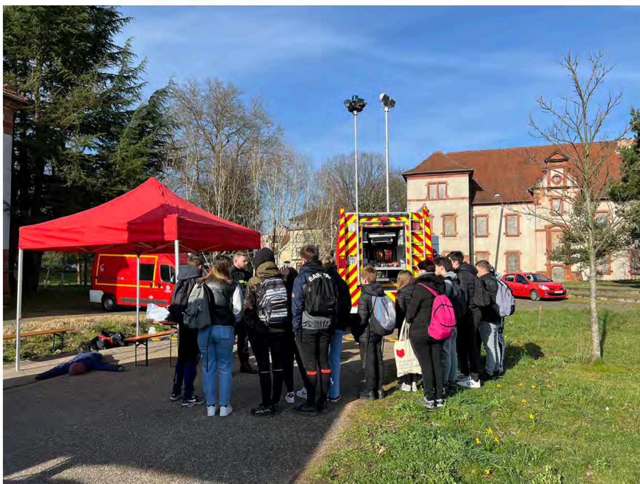
Crédits photographiques : Amandine Rat, Mairie de Bitche, Rallye citoyen 2023