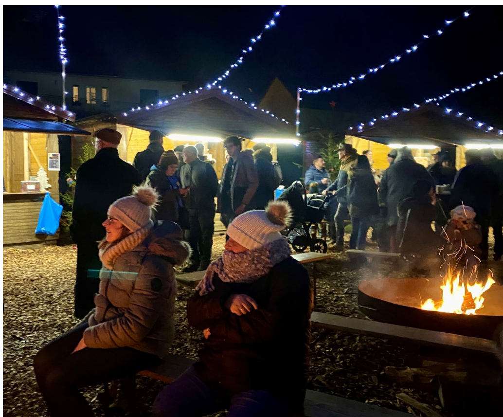
Autour du brasero à Noël, 2023

Comme par magie, des lumières scintillantes illuminent les cabanes et, sans attendre, une bûche par son crépitement, invite à venir se réchauffer au coin d'un feu. Il ne faut que peu de temps pour que les parfums irrésistibles aux notes sucrées se joignent à la fête et viennent embaumer la nouvelle place. La venue de ces gourmandises est célébrée par les musiciens qui ont pour mission de répandre la joie à tous les visiteurs. Enfin, les premiers rires éclatent, annonçant les retrouvailles des bons amis au village de Noël.