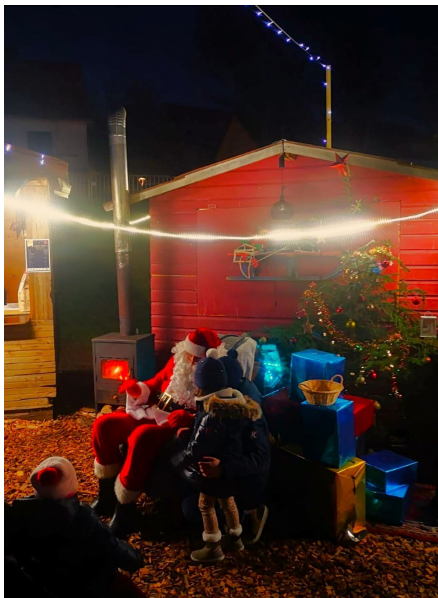
Le père Noël à Bitche, 2023