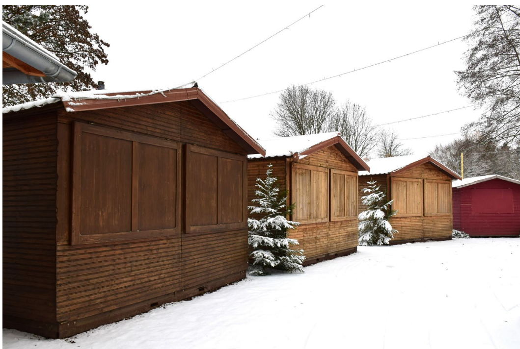
Chalets du village de Noël, 2023