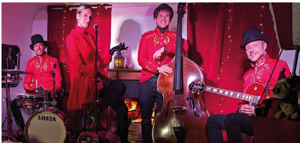
The Christmas Dream Jazz Band