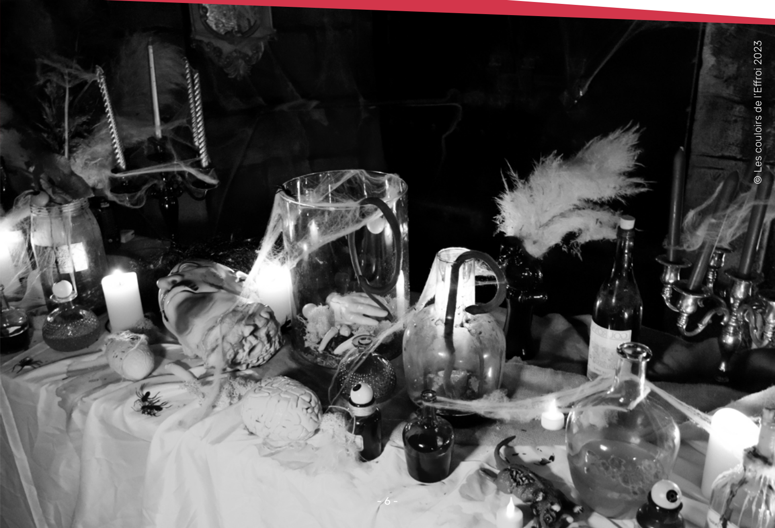
© Les couloirs de l'Effroi 2023