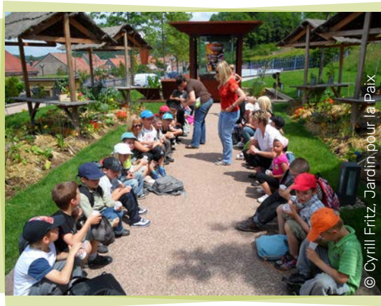
Jardin pour la Paix

Ce jardin contemporain déploie une esplanade de créations verdoyantes dont les thématiques varient au gré des années et d'un fertile partage d'idées. Développement durable, savoirs-faires ancestraux ou inspiration nostalgique sont parmi les ingrédients avec lesquels les jardiniers de Bitche accommodent leur florilège végétal et coloré. Dans la quiétude d'une flânerie, lancez-vous à la quête d'idées vertes !