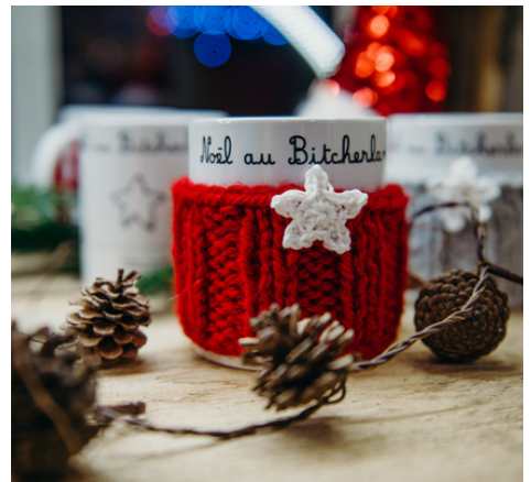
Boutique éphémère de l'Office de Tourisme du Pays de Bitche, 2022, crédit photo AMEM et OTIPB