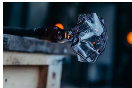
Site verrier de Meisenthal, 2023

ACCUEIL-BOUTIQUE L'équipe de la boutique vous réserve un accueil chaleureux et vous propose les collections de boules de Noël fabriquées à deux pas de là, au CIAV, dont STELLA , la dernière-née de ses collections.