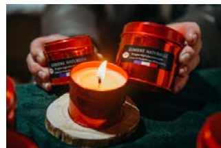
Village de Noël au parc du Stadtweiher, 2022, crédit photo A.Rat et AMEM

La place du village sera agrémentée de cinq chalets de restauration desservis par des restaurateurs et les associations locales. Un des chalets accueillera aussi le père Noël qui recueillera les vœux des enfants, dans l'attente des festivités, du 20 au 23 décembre.