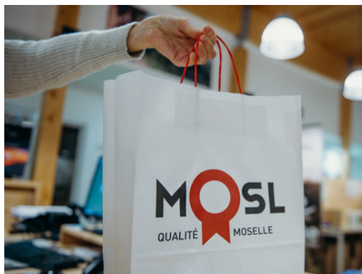
Boutique éphémère de l'Office de Tourisme du Pays de Bitche, 2022