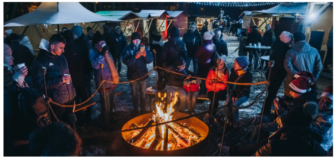
Village de Noël au parc du Stadtweiher, 2022, crédit photo AMEM

Un marché de Noël s'installera au sentier et viendra compléter le village de Noël avec des produits du terroir local, des objets manufacturés du Pays de Bitche et des articles thématiques incontournables.