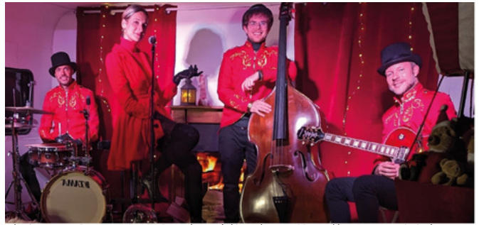
Christmas Dream Jazz Band

Venez écouter les plus belles chansons de Noël américaines, reprise par ce quatuor à l'énergie débordante pour réchauffer les cœurs et les corps ! (Un événement proposé par Moselle Attractivité)