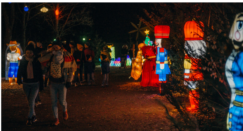
Sentier des lanternes au Parc du Stadtweiher, 2022

Le sentier des Lanternes de Bitche se déroulera sur près de trois cent mètres et sera ponctué d'innombrables surprises. Les yeux des grands comme ceux des petits enfants s'émerveilleront à chacune des huit escales des trois univers qu'offrira la traversée.