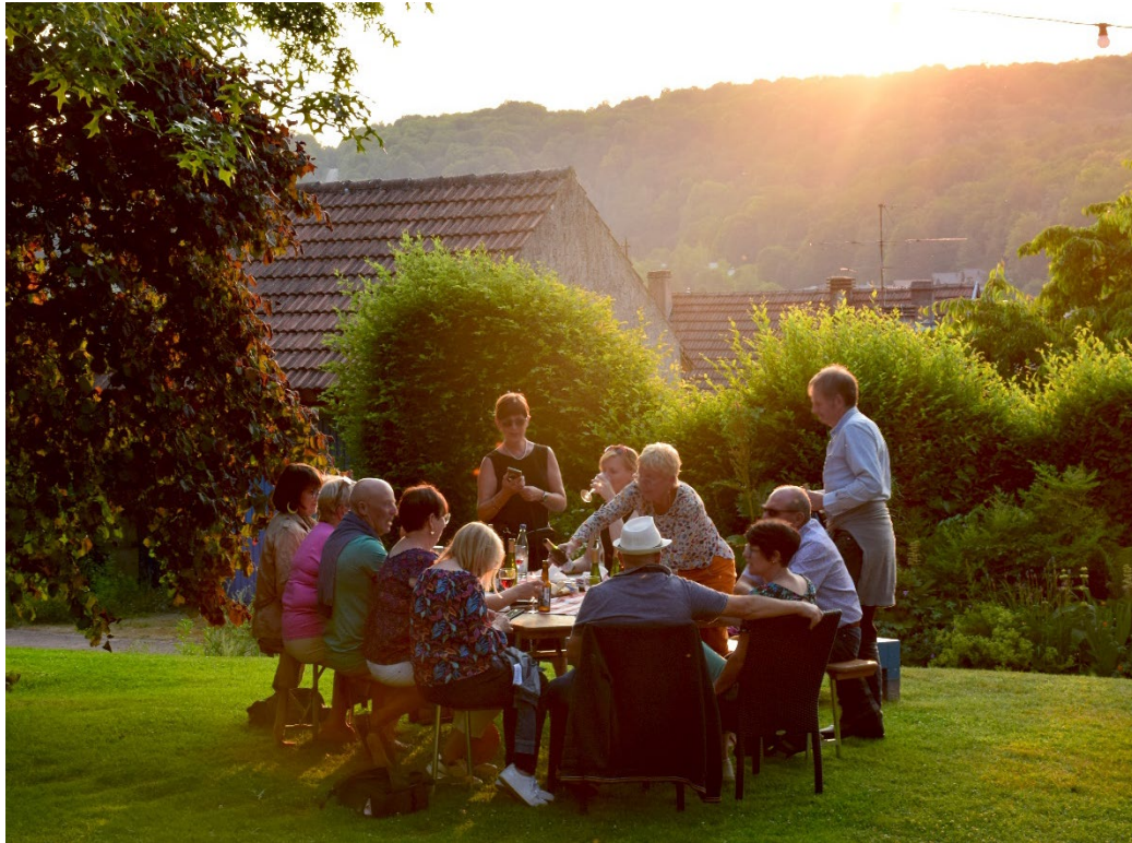
Barbecue-concert Lzair au jardin pour la Paix 16 juin 2023, Mairie de Bitche

Pour rompre la monotonie, profitez du crépitement du feu et des vapeurs épicées du barbecue ! En attendant l'arrivée du musicien, la grande terrasse de l'Accueille' vous accueillera pour partager un moment chaleureux. Peut-être préférerez-vous vous perdre dans le jardin et y apprécier la fraîcheur de la nuit tombante ?