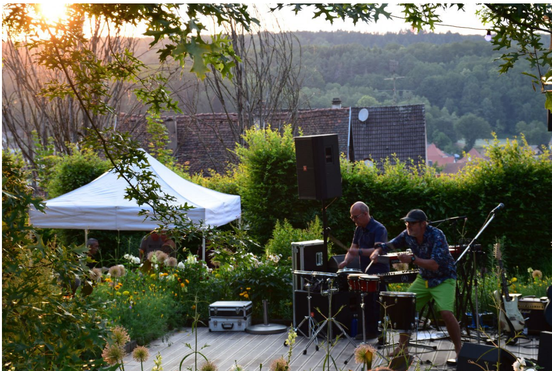
Barbecue-concert Lzair au jardin pour la Paix 16 juin 2023, Mairie de Bitche