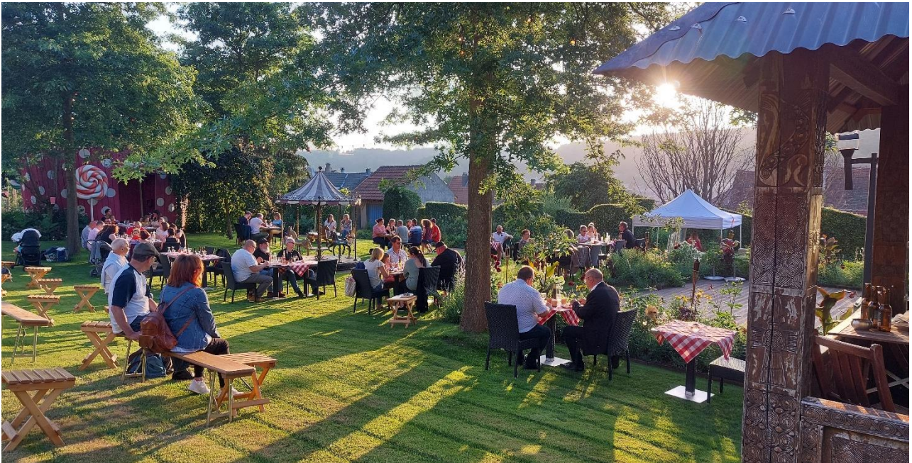
citadelle et jardin pour la Paix de Bitche

Pour rompre la monotonie, profitez du crépitement du feu et des vapeurs épicées du barbecue ! En attendant l'arrivée du musicien, la grande terrasse de l'Accueille't' vous accueillera pour partager un moment chaleureux. Peut-être préférerez-vous vous perdre dans le jardin et y apprécier la fraîcheur de la nuit tombante ?